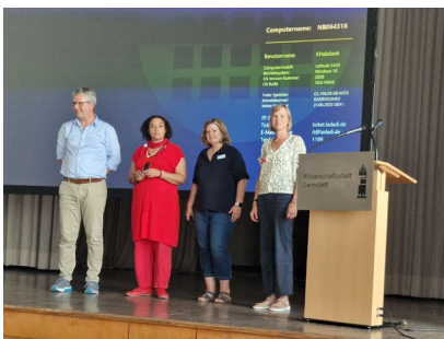
Bericht Bergsträßer Anzeiger vom 27.04.2023 Artikel ist als PDF angelegt

In Zusammenarbeit mit dem Büro für Migration und Inklusion des Landkreises Darmstadt-Dieburg und dem Amt für Vielfalt und Internationale Beziehungen der Wissenschaftsstadt Darmstadt haben wir diese Veranstaltung im Justus-Liebig-Haus ausgerichtet. Die Veranstaltung hatte zum Ziel, für die „Krebsvorsorge“ zu sensibilisieren und auf die wichtigen - u.a. auch mehrsprachigen digitalen - Möglichkeiten der Früherkennung aufmerksam zu machen. Im Vordergrund standen mehrsprachige und vielfaltsorientierte Formen der Prävention. Verschiedene Netzwerkpartnerinnen und -partner präsentierten ihre Arbeit beim Markt der Möglichkeiten mit Ständen.